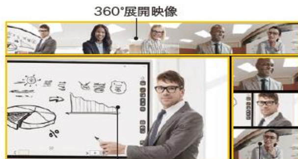
固定クローズアップ