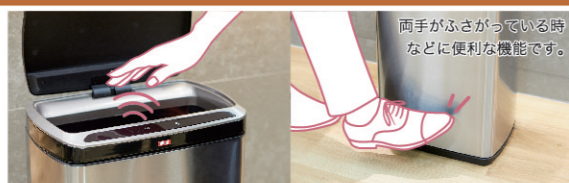
両手がふさがっている時などに便利な機能です。